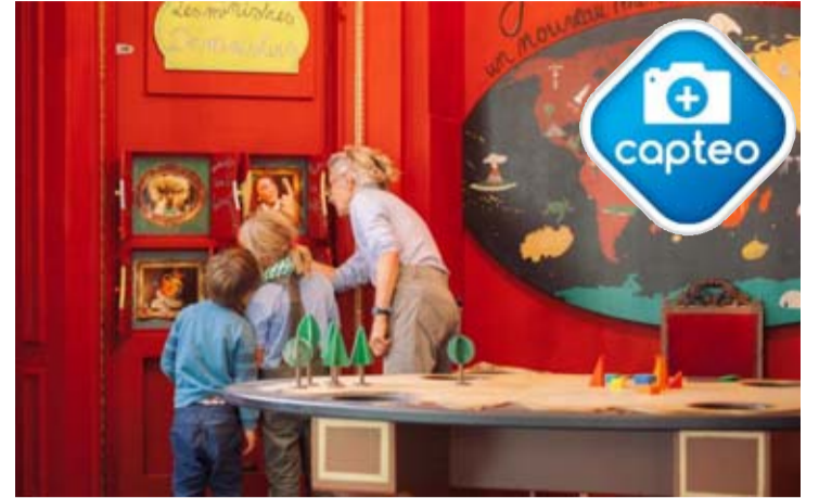
Photographiez l'image avec l'application Capteo.

Le Musée des enfants à Ixelles vient de rouvrir avec une toute nouvelle exposition sur le thème « grandir ».